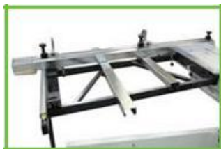
Конструкция форматного стола

Для обеспечения долговечности в конструкции станка реализована система смазки направляющих, которые отвечают за подъем/опускание пильных агрегатов.