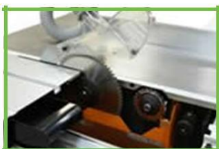
Электрорегулировка вылета пил

Механизм микрометрической настройки значительно упрощает установку параллельного упора. Регулировочный винт обеспечивает юстировку размера с точностью до миллиметра.