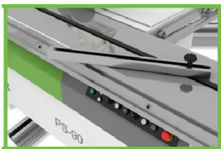
Линейка для раскроя под углом

Усиленная конструкция форматного стола на каретке позволяет надежно базировать крупногабаритные детали, что дает высочайшее качество и геометрию распила.